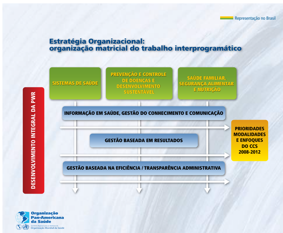
Figura 2: Enfoques fundamentais do Plano de Desenvolvimento Integral da Representação da OPAS/OMS no Brasil

A cooperação técnica da Organização se desenvolverá a partir de três enfoques fundamentais contidos na Estratégia de Cooperação Técnica da OPAS/OMS com o Brasil 2008-2012. Esses enfoques seguiram os conceitos do Plano Estratégico da OPAS 2008-2012 e estão alinhados aos Projetos AMPES e Gerências definidas no organograma institucional (Figura 2).