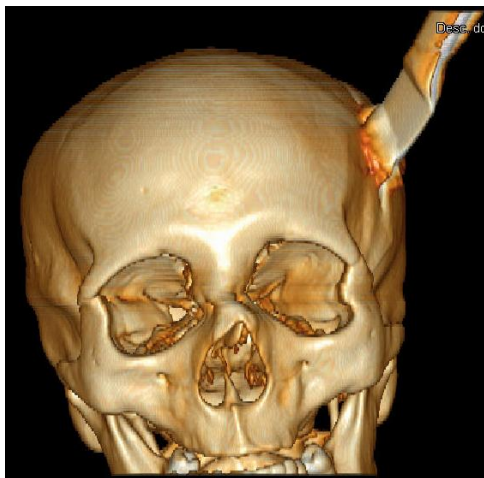
Figura 1: Tomografia de Crânio com reconstrução em 3D. Arma branca transfixando osso parietal esquerdo.

Homem, 29 anos, foi admitido no setor de urgência e emergência com história de agressão física e traumatismo penetrante de crânio por arma branca. O paciente apresentava pontuação na escala de Glasgow de seis pontos e pupilas isocóricas e fotorreagentes. Foram realizados os procedimentos iniciais para manutenção da estabilidade hemodinâmica do paciente com intubação orotraqueal e ventilação mecânica. A tomografia computadorizada do crânio mostrou que a arma branca transfixava o osso parietal esquerdo atingindo o parênquima cerebral e a reconstrução 3D da imagem revelou um trajeto oblíquo descendente da mesma (Figura 1 e 2). Durante o transporte até o bloco cirúrgico para procedimento de urgência o paciente sofreu uma parada cardiorrespiratória sem reversão apesar das manobras de reanimação instituídas.