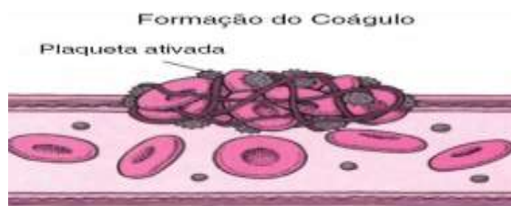
Figura 3. Representação de coágulo através da formação de malha de fibrina para reparação da parede vascular mediante uma injúria do epitélio. 1

O PRP é fonte autóloga de fatores de crescimento. E possui entre 1.000.000 e 1.500.000 plaquetas por microlitros. Os fatores de crescimento estimulam, principalmente, a reepitelização, a angiogênese, a mitose celular, a síntese de colágeno, a quimiotaxia dos neutrófilos, macrófagos e fibroblastos, que por sua vez proporcionam um aumento na síntese de colágenos e a produção de linfócitos com a produção de interleucina. 14