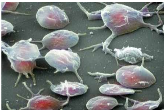
Figura 1. Microscopia eletrônica de uma agregação de plaquetas, onde pode ser visualizada a formação de seus pseudópodos. 18

A zona de organelas consiste, basicamente, de: grânulos alfa, que contêm proteínas adesivas, fator de von Willebrand (FvW), trombospondina, fator de crescimento derivado de plaquetas, fator IV plaquetário, fatores da coagulação e inibidor do ativador plasminogênio; grânulos densos, que contêm trifosfato de adenosina (ATP), difosfato de adenosina (ADP), serotonina, cálcio; componentes celulares, tais como lisossomos e mitocôndria, que além de conter ATP e ADP, também, participam dos processos metabólicos da plaqueta e armazenam enzimas e outras moléculas críticas para a função plaquetária. O sistema membranar inclui o sistema tubular denso, onde se encontra concentrado o cálcio, importante para desencadear os eventos contráteis e os sistemas enzimáticos envolvidos na produção de síntese de prostaglandinas. 9