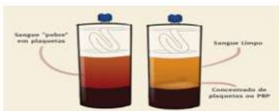
Figura 04: Representação de amostras de sangue pré e pós-centrifugação. 15

O PRP deve ser sempre autólogo devido ao risco de rejeição ou à impossibilidade de secreção de fatores de crescimento ativo. O sangue a ser utilizado deve ser colhido de maneira asséptica em tubos contendo, preferencialmente, citrato como anticoagulante. A manipulação do sangue durante a centrifugação deve ser realizada de forma cuidadosa e em rotação adequada para assegurar a separação das células plaquetárias de outras e para evitar ruptura ou danos à sua membrana. 19