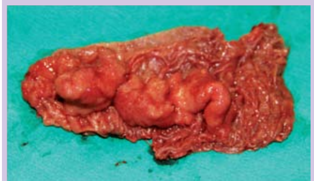
Foto 2: Quarta porção duodenal aberta longitudinalmente após ressecção, evidenciando lesão exuberante em sua luz.

Indicada a laparotomia, foi realizada EDA intraoperatória que localizou a lesão na quarta porção duodenal. O ângulo de Treitz foi liberado e feito ressecção do segmento duodenal correspondente, seguida de confecção de anastomose duodenojejunal término-terminal em plano único contínuo (foto 2).