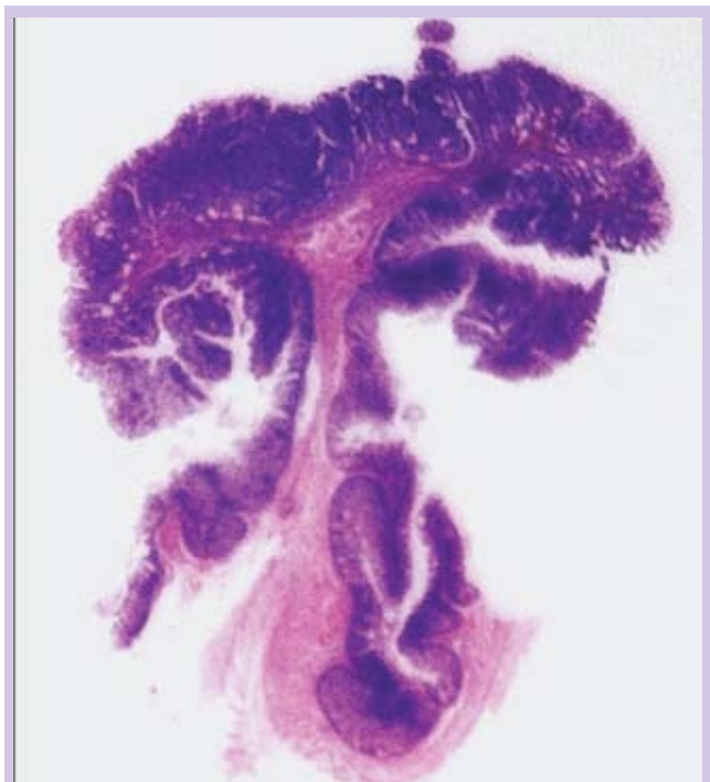
Fotomicrografia 1: Uma das preparações histológicas utilizadas no estudo anatomopatológico da peça cirúrgica (HE, 2,5X), evidenciando o aspecto polipoide da lesão.

O exame anatomopatológico mostrou segmento duodenal medindo 9,0 cm de comprimento e 5,5 cm de circunferência, apresentando lesão polipoide séssil, medindo 3,5 cm em seu maior eixo, distando 1,5 cm da menor margem de ressecção cirúrgica.