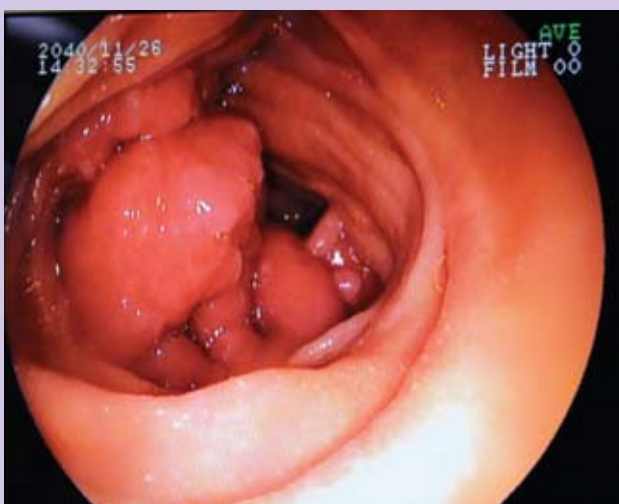
Foto 1: Lesão polipoide espalhada, ocupando boa parte de luz duodenal após a segunda porção.

O exame anatomopatológico revelou mucosa duodenal apresentando no córion, com ninhos de glândulas gástricas oxínticas. A tomografia computadorizada de abdome confirmou a presença de massa intraluminal duodenojejunal, sem outras alterações.