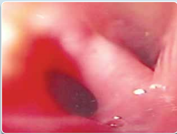
Figura 1: Divertículo de Zenker demonstrado na endoscopia digestiva alta.

O segundo caso se refere a um paciente de 72 anos, sexo feminino, com quadro de engasgo, halitose e disfagia crônica. A endoscopia digestiva alta mostrou saco diverticular de 2,5 cm.