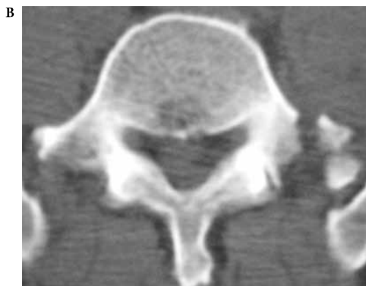
Figuras 1A e 1B - TC de coluna lombar apresentando fratura do processo transverso esquerdo de L5.