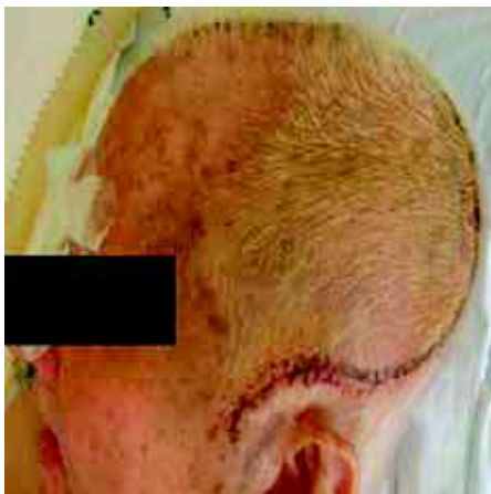
Figura 3 - Incisão de Becker.

Craniectomias com menos de 10 centímetros estão relacionadas a uma incidência maior de infartos parenquimatosos e hemorragias. 6 A ressecção do tecido cerebral infartado não tem sido recomendada. 6,7