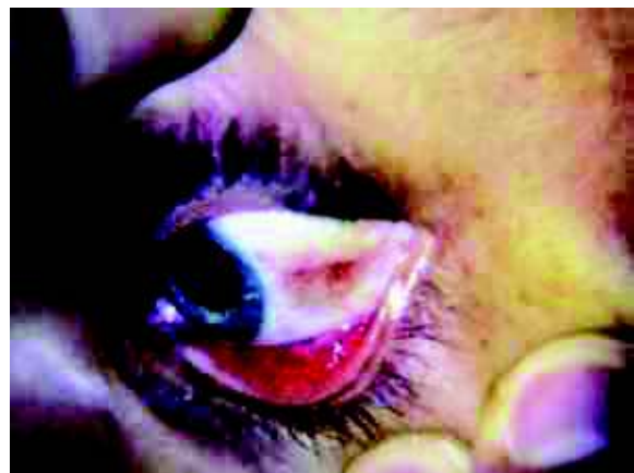
Figura 1 – Petéquias conjuntivais.

Os sinais clínicos não aparecem durante o intervalo de pelo menos 6 a 12 horas, após o acidente. Os sinais maiores aparecem, em 60% dos casos, dentro de 24 horas, e em 85%, dentro de 48 horas. Manifestações clínicas precoces são possíveis, mas raras. O início após 72 horas tem sido descrito em casos excepcionais. Ocasionalmente, a síndrome de EG de início tardio mimetiza um tromboembolismo pulmonar maciço. 1,34,35