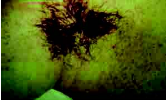
Figura 2 – Petéquias em região axilar.