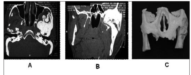
Figura 2. Paciente masculino de 67 anos com histórico de aumento de volume na região de ATM esquerda, devido à anquilose, desde a infância relacionada a trauma. (A) Corte axial, com janela para tecido ósseo e (B) Corte coronal, com janela para tecido ósseo. Observar em A e B área hiperdensa na região de ATM esquerda com envolvimento de osso zigomático, arco zigomático, processo pterigoide do osso esfenóide e osso temporal. (C) Protótipo rápido demonstrando assimetria facial.

A TC por feixe cônico também tem se mostrado de grande valia por ser um exame rápido e de alta qualidade 23 .