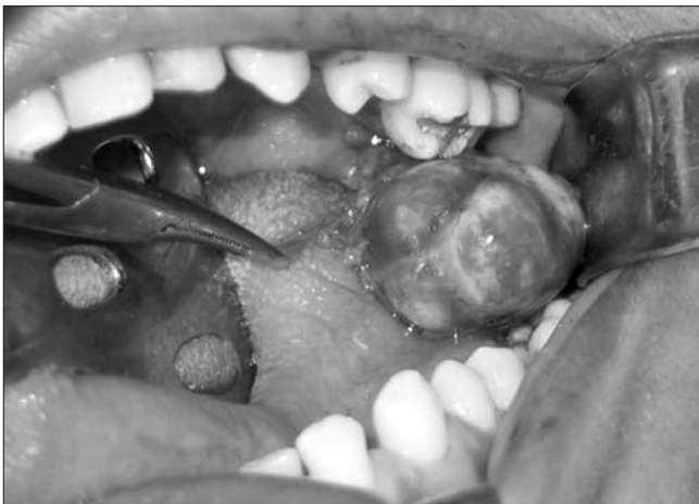
Figura 3. Lesão palatina sendo removida. Não houve dificuldade para separá-la dos tecidos adjacentes

são (Figura 2). Inicialmente a PAAF (punção por agulha fina) foi aspirado conteúdo líquido sanguinolento viscoso. Sob anestesia geral foi realizada biópsia excisional por meio de uma incisão retilínea em mucosa palatina na parte posterior do palato mole e divulsão cuidadosa dos tecidos. No trans-operatório, foi constatado que a lesão apresentava-se encapsulada e com limites bem definidos, facilitando a remoção com plano de clivagem (Figura 3). A mucosa superficial à lesão foi preservada o que facilitou o fechamento por sutura simples com Vicryl® 3-0 com cicatrização por primeira intenção. O pós-operatório transcorreu sem intercorrências. O espécime cirúrgico foi submetido a exame anatomo-patológico, com inclusão de todo material. Na análise macroscópica, percebeu-se fragmento irregular de tecido, de aspecto multi-nodular e parcialmente revestido por pseudo-cápsula transparente com conteúdo brilhante, consistência fibroelástica e firme, medindo aproximadamente 2,5 x 3,5 x 1,2 cm. Ao exame microscópico, a neoplasia era constituída por uma mistura de componente epitelial, glandular, mioepitelial e estroma me-