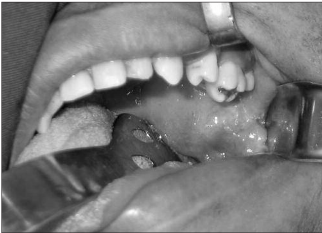
Figura 1. Lesão nodular recoberta por mucosa íntegra em região lateral de palato mole

matologia Buco-Maxilo-Facial do Hospital das Clínicas da FMUSP, para avaliação de lesão em palato. Ao exame físico intra-oral, foi observado um nódulo de aspecto lobulado localizado em palato mole, lateralmente ao plano mediano à esquerda, medindo cerca de 3 cm de diâmetro e com mucosa de recobrimento íntegra (Figura 1). À palpação apresentava-se indolor e de consistência fibroelástica. Na anamnese, a paciente relatou ter notado sua presença há 5 anos, havendo aumento lento de tamanho. Apesar de não referir dor a paciente relatou leve desconforto durante a deglutição. A hipótese diagnóstica foi de neoplasia benigna de glândula salivar menor. Diante do quadro foram solicitados exames laboratoriais pré-operatórios de rotina (hemograma e coagulograma) e tomografia computadorizada (TC) para realização de biópsia excisional, optada frente aos achados da TC e aos dados da história da lesão. A TC com contraste endovenoso demonstrou lesão lobulada circunscrita hiperatenuante em relação às estruturas vizinhas permitindo a avaliação precisa das estruturas vasculares adjacentes e da real extensão completa da le-