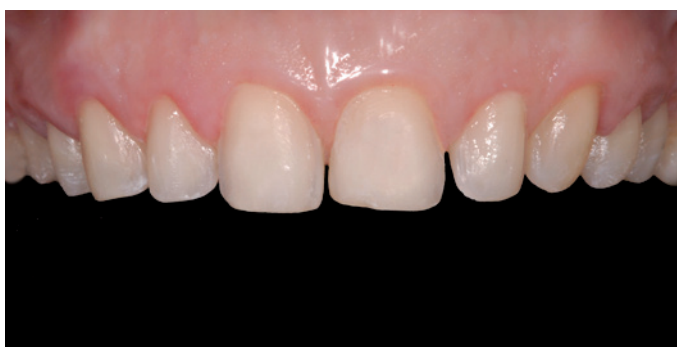
Figura 6. Preparos finalizados (vista frontal).

Após a remoção dos provisórios, as facetas foram provadas na boca posicionando-as com pasta específica para este procedimento ( Variolink II Try In , Ivoclar Vivadent AG, Liechtenstein) e verificação de características estéticas (Fig. 9). Na sequência, após a aprovação da paciente e checagem de margens das restaurações, foi realizado o procedimento de cimentação dos elementos cerâmicos. As superfícies internas das restaurações foram condicionadas com ácido hidrófluorídrico (HF) a 4% ( Porcelain etchant , Bisco, USA) por 60 segundos (Fig. 10a). Após o tempo de tratamento recomendado, o ácido foi lavado e a peça recebeu abundante jato de ar/água para completa remoção de resíduos