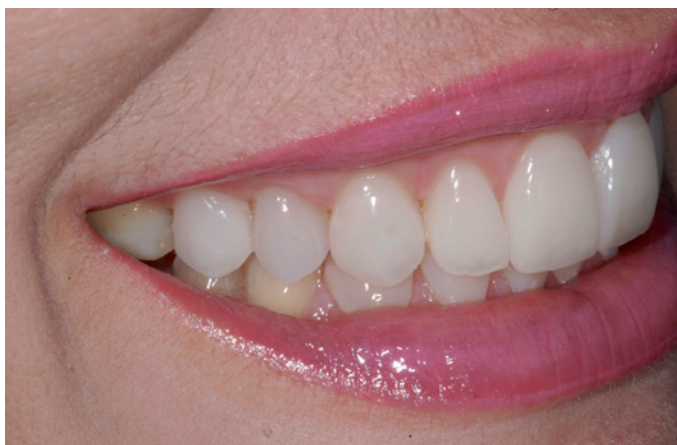
Figura 16. Observe a naturalidade e harmonia após 2 anos da cimentação.