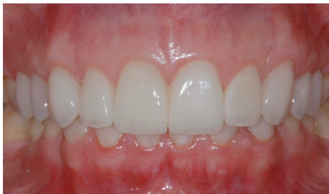
Figura 12. Aspectos após a cimentação adesiva dos laminados cerâmicos.

(Fig. 11b). A superfície recebeu a aplicação de um agente adesivo ( Exite , Ivoclar Vivadent AG, Leichtenstein), seguido de um leve jato de ar (Fig. 11c) e fotoativação por 15 segundos. Para cimentação, utilizou-se um cimento resinoso fotopolimerizável (pasta base, Variolink II , Ivoclar Vivadent AG, Leichtenstein). As figuras 12 e 13 mostram as facetas já cimentadas. As figuras 14, 15 e 16 revelam que a inter-relação Periodontia e Dentística superou as expectativas da paciente, devolvendo harmonia, jovialidade e naturalidade para face e sorriso.