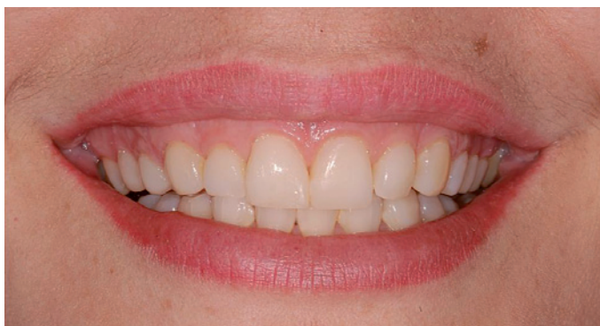
Figura 2. Observe um sorriso discreto para menor visualização da exposição da gengiva