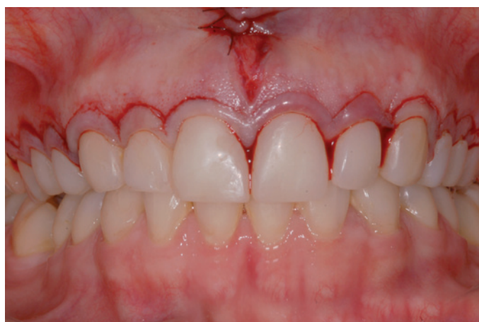
Figura 5. Aspecto da cirurgia periodontal.

Após o enceramento e conseqüente recontorno anatômico dos dentes no modelo de gesso, foi realizada uma moldagem sem moldeira, com a pasta densa de uma silicona de adição ( Virtual , Ivoclar Vivadent AG, Liechtenstein), obtendo-se assim uma guia, que foi utilizada para a realização do ensaio diagnóstico intrabucal ou "mock-up". A guia de silicona foi preenchida com uma resina fluida bisacrílica ( Protemp , Bis-Acryl Provisional Material, 3M ESPE, USA) e levada à boca até sua completa polimerização (4,5 minutos). A figura 4 mostra o resultado do mock-up do lado direito para auxílio da cirurgia periodontal. Após a confirmação e detalhamento da plástica gengival executou-se a cirurgia propriamente dita (Fig.5).