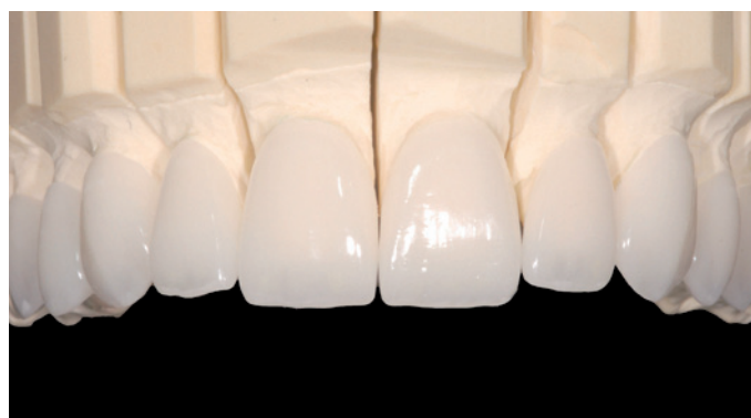
Figura 8. Facetas cerâmicas posicionadas no modelo de gesso.