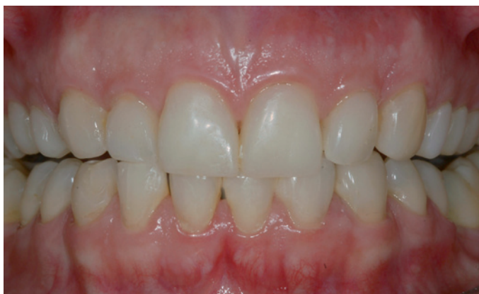
Figura 3. Presença de facetas diretas de resina composta deficientes na cor e forma.

frequentes fraturas e lascamentos, assim como os manchamentos presentes nas mesmas. No exame clínico, analisou-se a face, o sorriso, contorno gengival e características dentais. Em seguida, foram realizados os exames radiográficos complementares e fotografias clínicas padrão (Fig. 3). Ante a queixa da paciente, coleta de dados na anamnese e análise dos exames realizados (clínico, radiográfico e fotográfico), determinou-se um diagnóstico e elaborou-se um plano de tratamento; propondo, assim, um planejamento clínico a ser executado com a intervenção cirúrgica periodontal para correção do sorriso gengival e confecção de laminados cerâmicos.