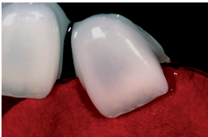
Figura 7. Aspecto vítreo das cerâmicas IPS Empress Esthetic