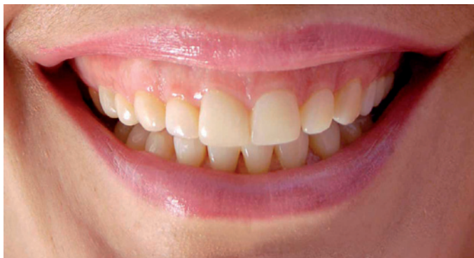
Figura 1. Aspecto inicial do sorriso espontâneo.