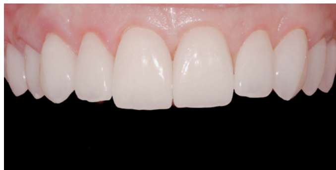
Figura 9. Momento da prova das facetas.