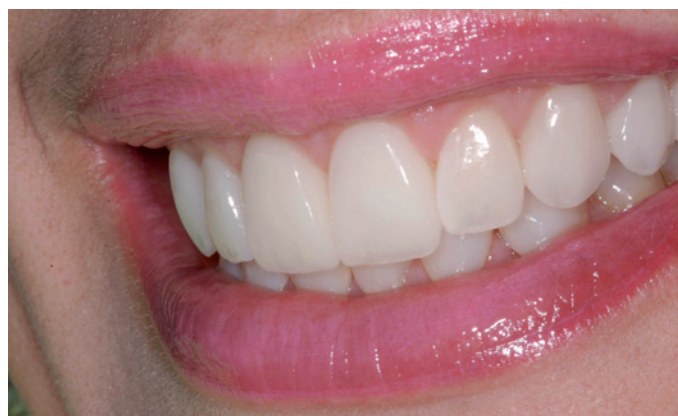
Figura 15. Visão lateral do sorriso após 2 anos da cimentação.