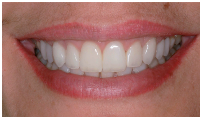
Figura 13. Observe a forma, textura, cor e harmonia dos dentes.