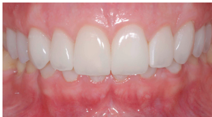
Figura 14. Aspecto das facetas cerâmicas após 2 anos.